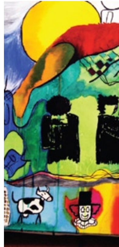
Arjan Kastelein Voorzitter College van Bestuur

Geen verslag zonder vooruitblik, zeker voor een scholengroep die bekend wil staan als 'ambitieuze, betrokken en in voor vernieuwing'. We streven naar verdere verbeteringen van onze onderwijsresultaten en moderniseren waar nodig en mogelijk. Bij het laatste gaat het natuurlijk om ICT, maar ook om nieuwe onderwijstypen als het technasium of het vakcollege. In het magazine kunt u ook lezen over onze ambities rondom goed werkgeverschap, van eminent belang om ook op langere termijn te zorgen voor uitstekend onderwijs in het Gooi!